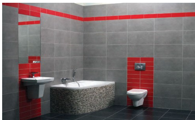
Īpašā SilicaActive sastāva dēļ CE 40 šuvei ir izturīga un intensīva krāsa.