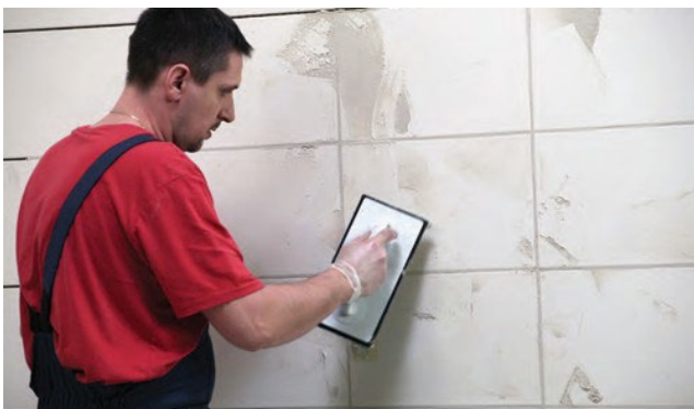
Šuves starp flīzēm ar CE 40 javu jāaizpilda precīzi.

CE 40 ir jāieber iepriekš nomērītā tīra ūdens daudzumā un jāsamaisa, līdz tiek iegūta viendabīga masa bez kunkuljiem. Neizmantot sarūsējušus vai netīrus traukus un darbarīkus. Pagaidīt 3 minūtes un samaisīt vēlreiz. Izklieš javu pa flīžu virsmu ar gumijas rīvdēli vai skrāpi. Jāpievērš uzmanība, lai piebļīvējot šuves, starp flīzēm nepaliktu atstarpes.