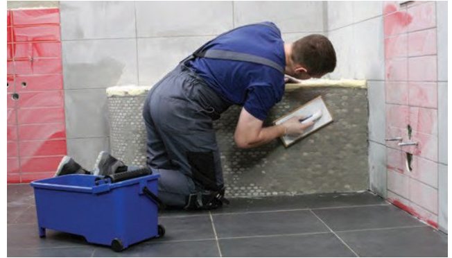
CE 40 java ir piemērota arī mozaikas izšuvošanai.

audumu, jo, ieberzējot izžuvušo šuvju javu mitrā javā, pastāv risks, ka var mainīties krāsa. Pa flīzēm var staigāt jau 6 stundas pēc izšuvošanas. Tad ir atļauta arī sausā tīrīšana (iepriekš pārliecināties, ka šuvju pildījuma virsma ir pilnībā sausa) un, ja nepieciešams, flīžu tīrīšana ar mitru, asu sūkli. Pirmoreiz ūdens iedarbībai javu var pakļaut pēc 24 stundām. Pirmās 5 dienas pēc uzklāšanas tīrīšanai izmantot tikai tīru ūdeni bez jebkādu tīrīšanas līdzekļu pievienošanas. Pilnībā hidrofobas īpašības (izturība pret ūdens uzsūkšanos) java sasniedz 5 dienas pēc tās uzklāšanas.