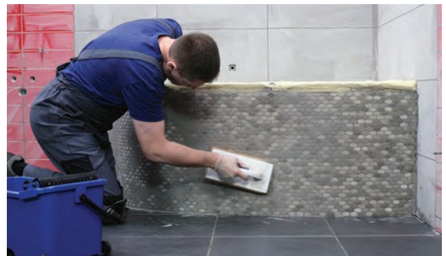
Profilējot jāizdara aplveida kustības.