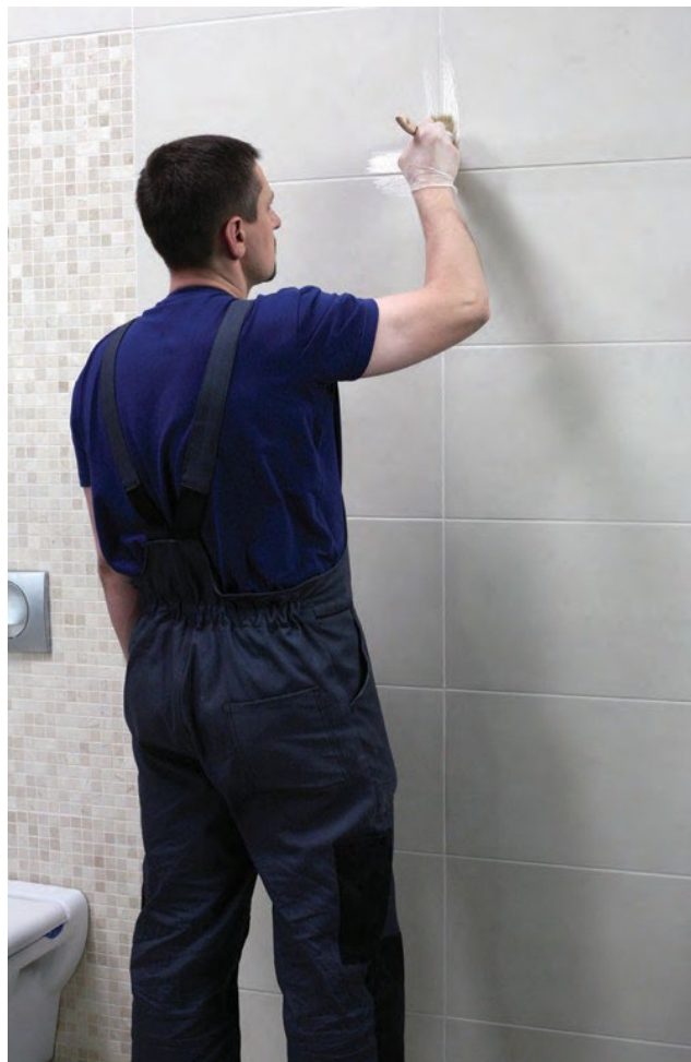
Šuvi papildus var aizsargāt ar impregnēšanas līdzekli Ceresit CT 10.