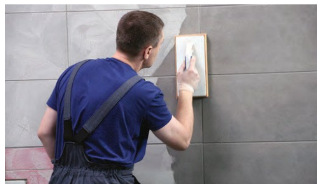
Profilēšanas laiks ir no 5 līdz 30 minūtēm.