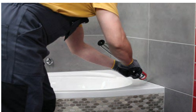
Šuves ap sanitārtehnikām ir jāaizpilda ar sanitāro silikonu.